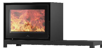
S709 + Table PA2021N011

MEDIDAS / DIMENSIONS / DIMENSIONS / MISURE 1305 x 684 x 460 mm