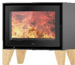
S709 + Wood PA2021N013

MEDIDAS / DIMENSIONS / DIMENSIONS / MISURE 710 x 784 x 460 mm