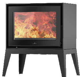
S709 + Spider PA2021N009

MEDIDAS / DIMENSIONS / DIMENSIONS / MISURE 769 x 930 x 521 mm