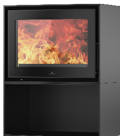
S709 + Cube PA2021N010

MEDIDAS / DIMENSIONS / DIMENSIONS / MISURE 710 x 982 x 460 mm