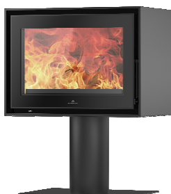
S709 + Round PA2021N012

MEDIDAS / DIMENSIONS / DIMENSIONS / MISURE 710 x 1008 x 460 mm