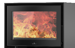
S709 + Wall PA1090G067

MEDIDAS / DIMENSIONS / DIMENSIONS / MISURE 710 x 580 x 460 mm