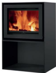
S600 + Cube

MEDIDAS MEDIDAS / DIMENSIONS DIMENSIONS / MISURE