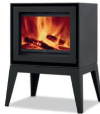
S600 + Spider

MEDIDAS MEDIDAS / DIMENSIONS DIMENSIONS / MISURE