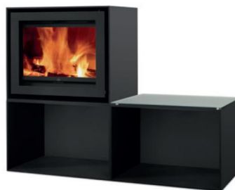
S600 + 2x Cube

MEDIDAS MEDIDAS / DIMENSIONS DIMENSIONS / MISURE