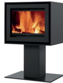
S600 + Square

MEDIDAS MEDIDAS / DIMENSIONS DIMENSIONS / MISURE