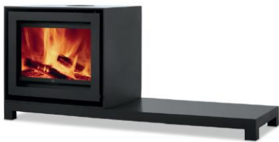
S600 + Table

MEDIDAS MEDIDAS / DIMENSIONS DIMENSIONS / MISURE