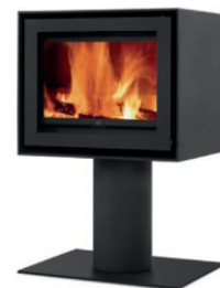
S600 + Round

MEDIDAS MEDIDAS / DIMENSIONS DIMENSIONS / MISURE