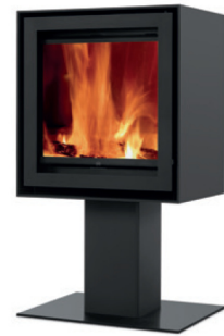
S600H + Square