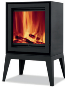
S600H + Spider