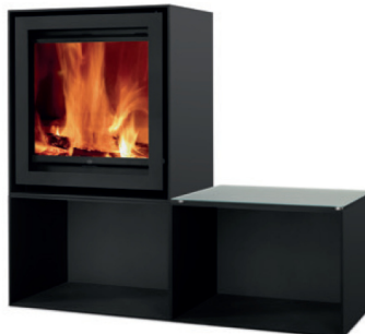
S600H + 2x Cube