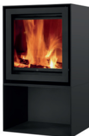
S600H + Cube