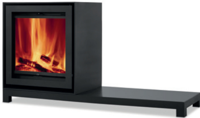
S600H + Table